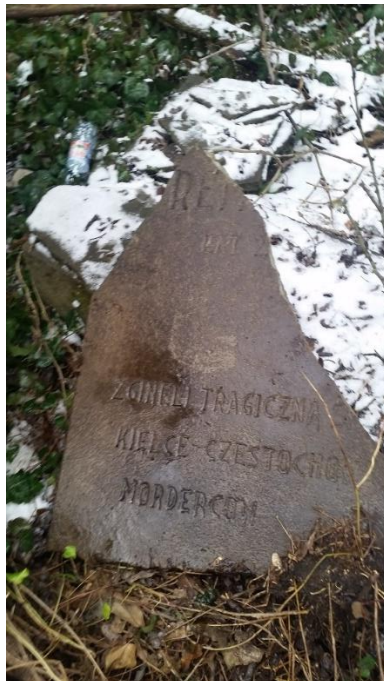
שבר המצבה שנמצא בבית העלמין בצ'נסטוהובה